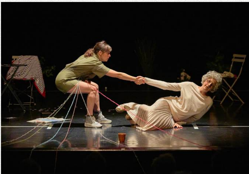
« Suzanne » de Marine Garcia-Garnier, 2023 – Théâtre de Saint-Michel en l'Herm

Le travail de fiction a aussi été enrichi par des lectures fondatrices comme « Les Fossoyeurs » de V. Castanet sur le scandale Orpéa, « Vie, vieillesse et mort d'une femme du peuple » de D. Eribon, la bande dessinée « La Dame Blanche » de Quentin Zuttion ou encore « Les Métamorphoses » d'Ovide.