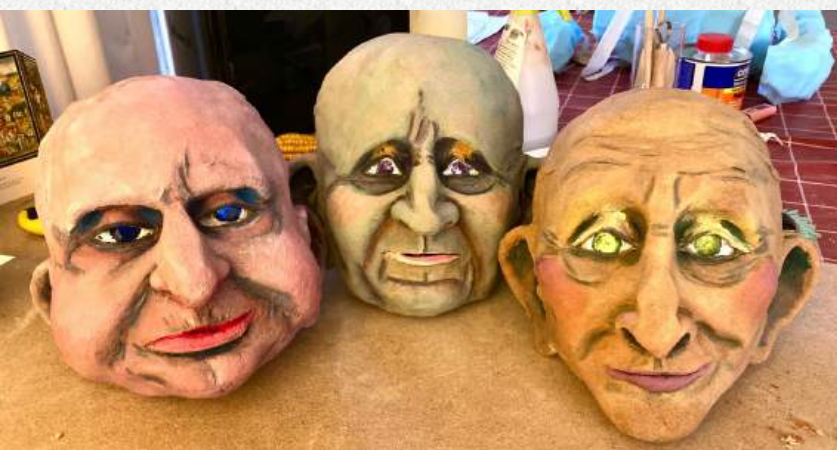
Pose des yeux et peinture