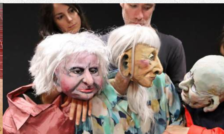
Essais corps et cheveux