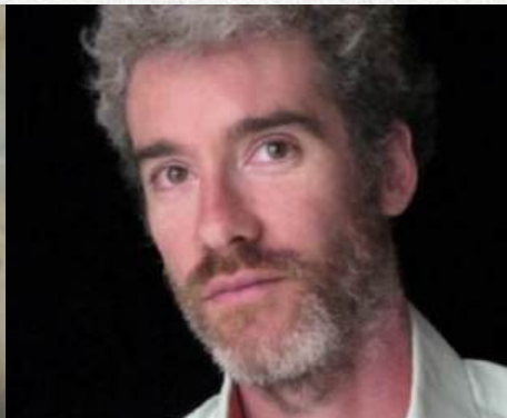
STEPHANE BIENTZ Acteur-marionnettiste